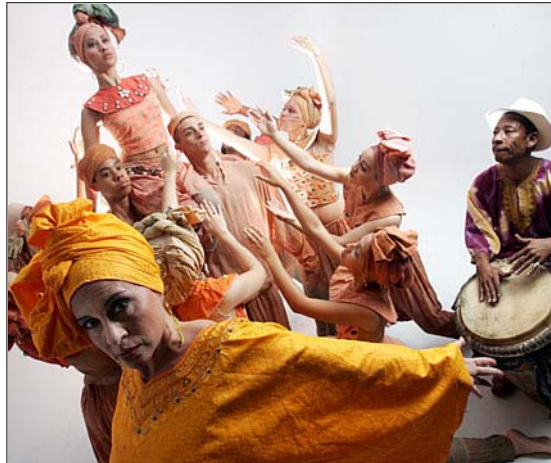
Cepeda sabe que esta segunda edición puede atraer más público.

"La energía es tan positiva y avasalladora en la actividad que la gente sale contenta, le dura un año la alegría y se quedan esperando el otro", advierte sobre la presentación del pasado año.